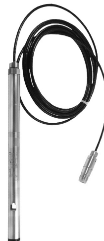
DCX-22 SG CTD DCX-22 VG CTD