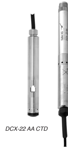
DCX-22 AA CTD

Le versioni DCX-22 SG/VG CTD sono dotate di un collegamento cavo, per cui non occorre rimuovere lo strumento dal tubo di scandagliamento per leggere i dati. Il connettore d'interfaccia è fissato alla superficie per mezzo di un dispositivo di bloccaggio. Per la versione VG (misurazione della pressione di riferimento), il tubo capillare di compensazione di riferimento è inserito nella parte superiore del contenitore (connettore d'interfaccia), in cui si trova l'apertura di riferimento, protetta da una membrana Gore-Tex®.