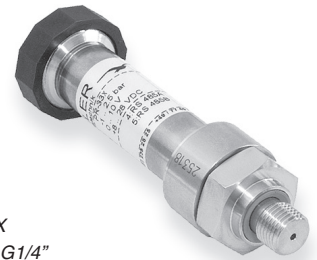
Serie 33 X filettatura G1/4"

E' possibile impostare l'uscita a scala naturale del trasmettitore in modo che corrisponda a qualsiasi campione di vostra scelta agendo sulla regolazione dell'incremento tramite il software PROG30.