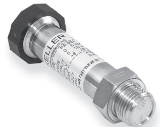
Serie 35 X G1/2", membrana affacciata