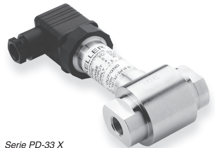
Serie PD-33 X